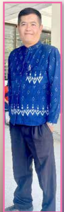
ส.อ.ผจญ โตอดตชนม์ ผ.อ.กองสวัสดิการฯ